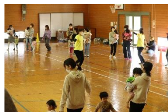
大きな輪になってみんなで踊った フルーツポンチ