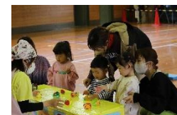
お店屋さんで買い物