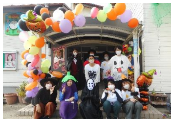
役員の皆さんも仮装で大変身！

10月は行事が盛りだくさんでした！その中から育友会のハロウィン秋まつりと、乳児クラス運動会をご紹介します！