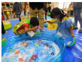
釣れるかな…？大きいのが釣れたよ！

紙飛行機、衣装づくり、〇×クイズ、さかなつりなど4つのおたのしみのコーナーを親子で一緒に楽しみました！