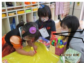
どんな衣装作ろうかな