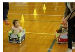
ブービー 楽しいね