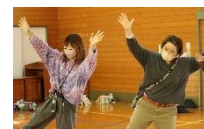
お母さんたちも ノリノリ♪