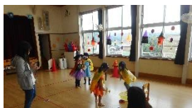
的をしぼって…えいっ！紙飛行機でホールインワン！