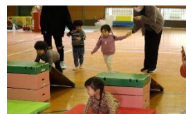
サーキットコーナー ぴよんぴよん跳べるよ！