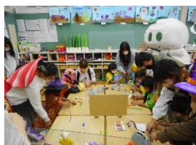
親子で一緒に折り紙を折ったよ！