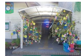
今年の七夕かざり