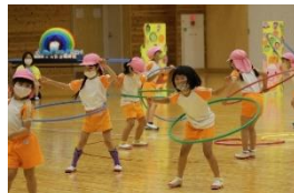
ぶどう組の「Let's challenge!」 挑戦してみたいものを選んで、「ほら、見て！」 「こんなこと、できるよ！」 大きな拍手、うれしかったね！