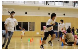
ぶどう組親子競技 「親子対抗リレー」 お父さんも本気!?で走ります。勝利はどっち？