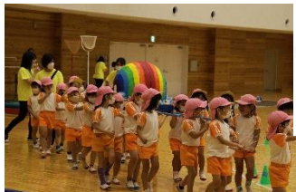
ぶどう組による開会式でのおみこしかつぎ。 みんなで「わっしょい！」