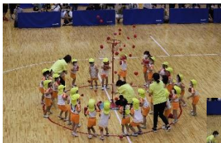
やっぱり盛り上がる 玉入れ&大玉ころがし 「がんばれ～！」