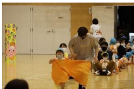
親子の息もぴったり！ デカパン競走