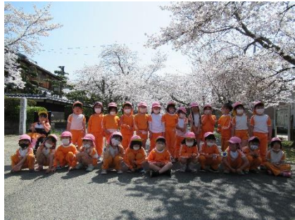
桜のトンネルきれいだね！