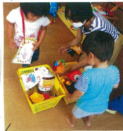
「親子みんなぞ」お片付け... ありがとう!!