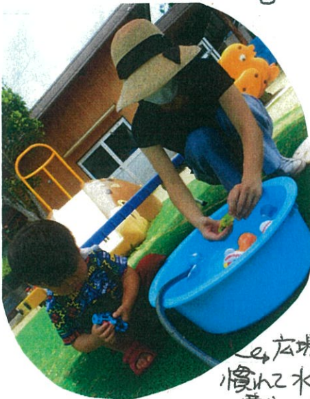
「広場にすっかり 慣れた水遊びに 夢中のお友だち」