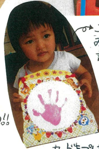
この日のお友だちは みんな5月生まれ 誕生カードに 手型を押して... 気に入ってくれて すぐ身につけて 遊んでいました! 1ヶ月遅れ となりましたが カードをプレゼントできました♪