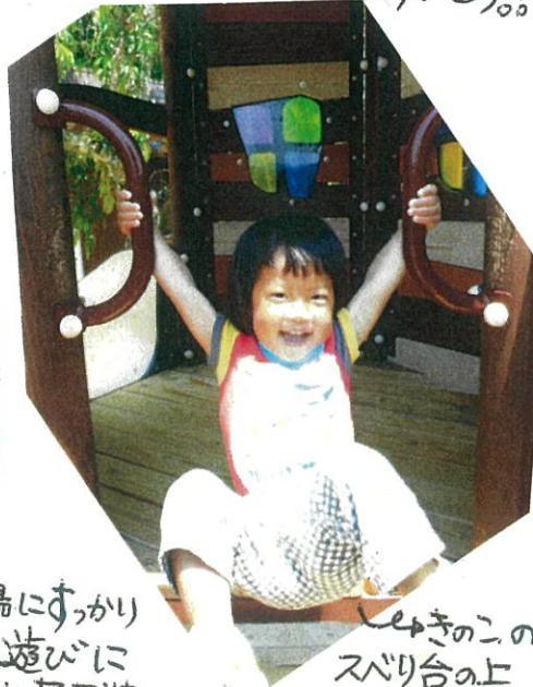
「きこの スベリ台の上 はまからすべりま〜す!